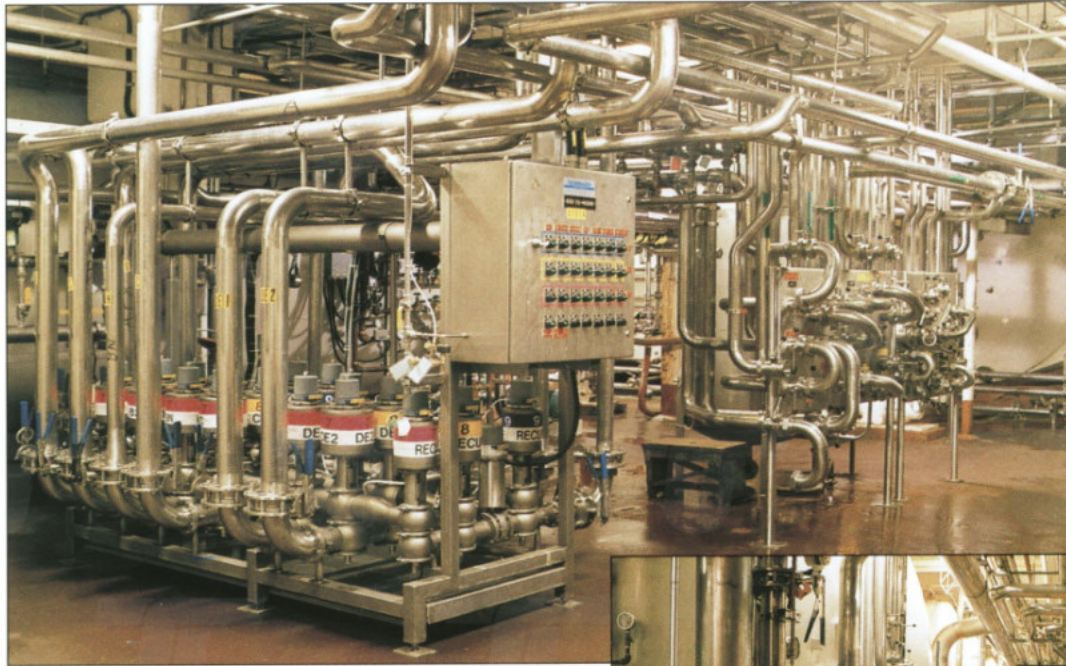
Agencements matriciels de valves sanitaires