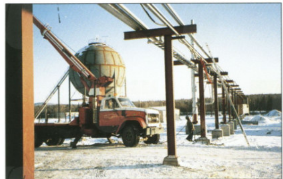
Industrie de transformation par cryogénie et tuyauterie isolée sous vide