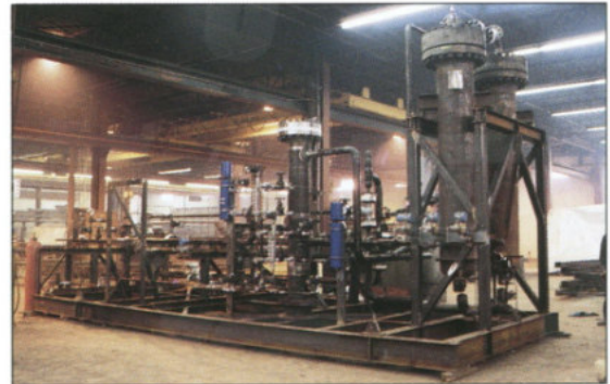
Atelier de fabrication

Un personnel bien entraîné et hautement qualifié offre un service complet sur toutes nos installations. Thomas O'Connell Inc. vous propose aussi un service de maintenance et d'entretien forfaitaire ou en régie contrôlée.