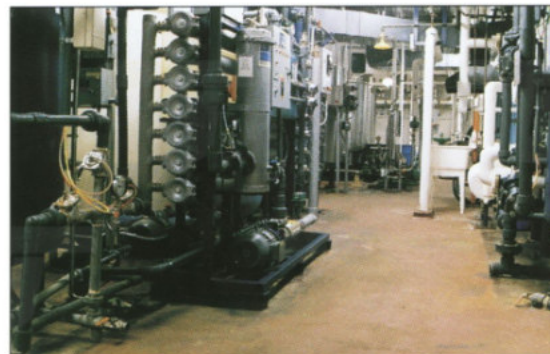
Système d'eau purifiée, osmose